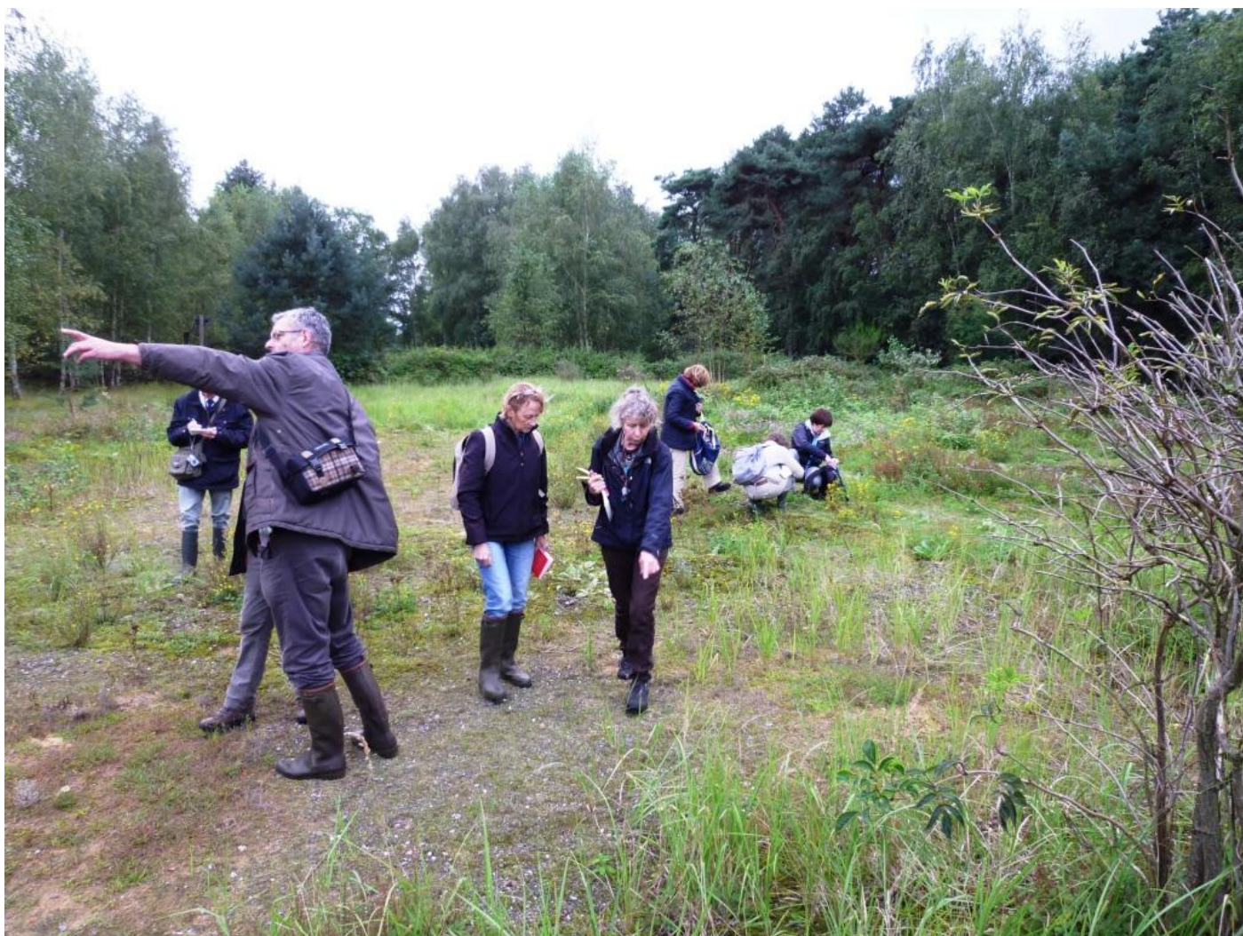
Nog meer bekende slobkousen